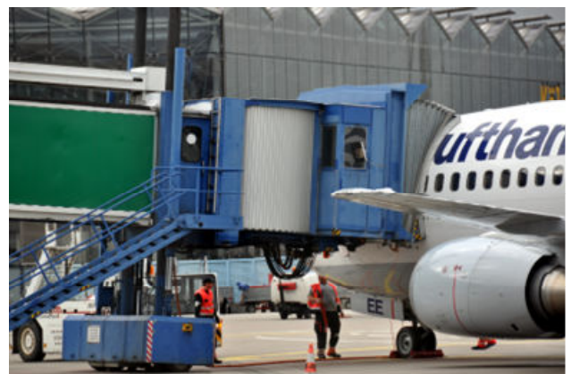
Bild: Lufthansa-Passagiermaschine am Flughafen Köln/Bonn